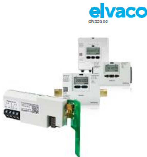
kamstrup 3. generációs mérőcsalád

Nyomógomb: indítás / reboot / kikapcsolás Beállítás NFC Elvaco OTC app vagy adatlekérdezés