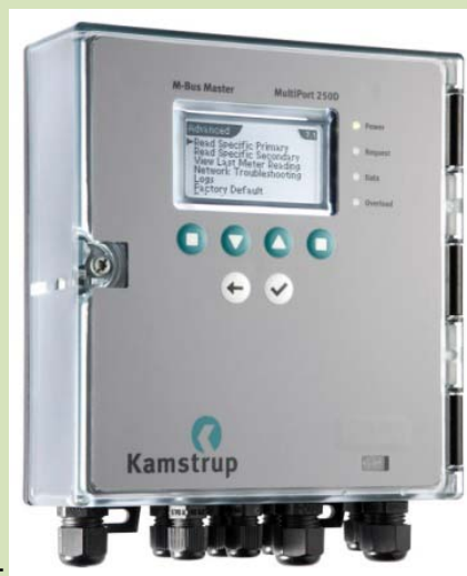
M-Bus MASTER Mult iPort 250