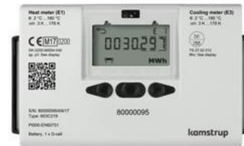
2017 • MULTICAL 603