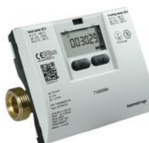
2016 • MULTICAL 403