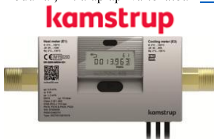
2013 • MULTICAL 302

Fontos infó: valamennyi általunk forgalmazott hőmennyiségmérő rendelhető vezeték nélküli M-Bus moduldal, ill. alaplapi változatban MULTICAL 302 esetén.